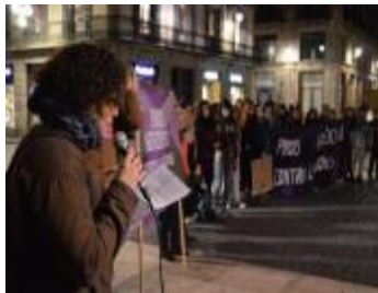
15/2/16 Novembre Feminista