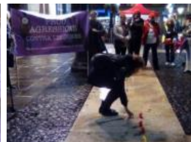
19/12/16 Batecs de sons