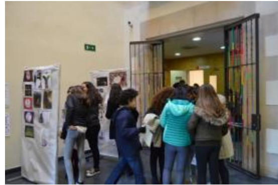
Imatges de l'exposició de les obres del concurs, al Casal de Joves Palau Alòs