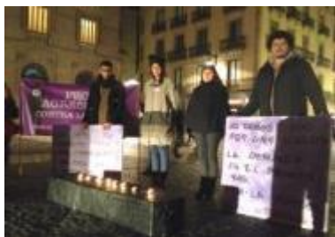
18/1/16 AVALOT UGT

Imatges de les accions, durant els diferents mesos: