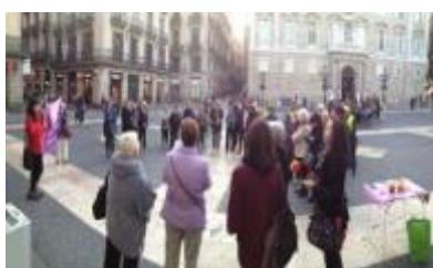
18/4/16 FACEPA i Col·lectiu de dones en l'església