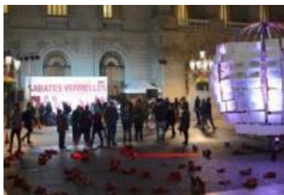
21/11/16 Femicidio.net, Dones no Estàndards, Ca la Dona, laioflautas