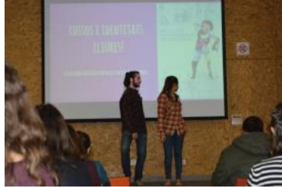
Actuació de dansa del grup Bacantoh

Les bases del concurs, la resolució del Jurat i les obres guardonades, es poden visitar a la web de la Plataforma: