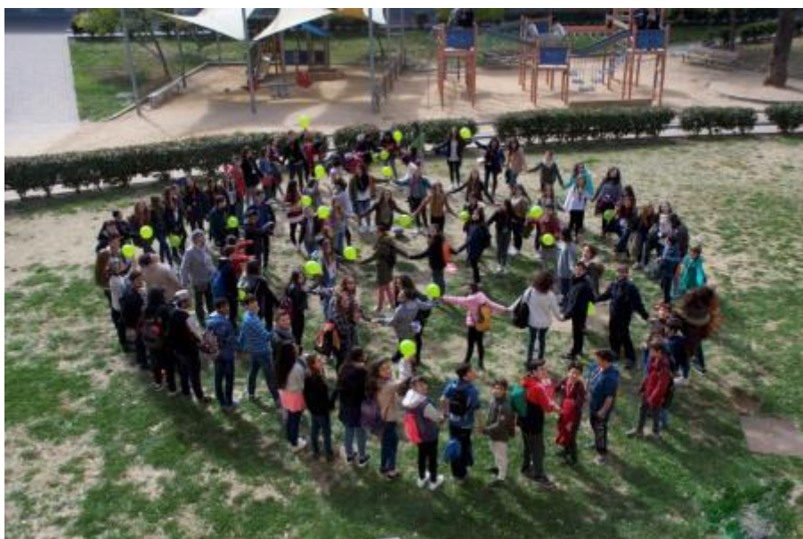
Imatge grupal de la 2a Trobada de la XAJI 4 de març 2016, Cornellà

També hem millorat la metodologia de treball, respecte a anys anteriors. Actualment, existeixen dos grups de treballs que s'ocupen de la XAJI. El primer s'ocupa de la formació de les i els joves participants i està format per 3 entitats: Homes Igualitaris, Fundació Aroa i Gogara. El segon grup de treball s'ocupa de les trobades de la XAJI, que han pres molta importància al llarg del 2016, permetent als i les participants de la XAJI conèixer-se entre ells i elles, intercanviar bones pràctiques, aprendre i adonar-se de l'amplitud de la xarxa. En 2016 s'han organitzat dues trobades (4 de març i 14 d'octubre) i el nombre d'entitats responsables dels dos esdeveniments ha pujat de 3 a 10. Les entitats són: Homes Igualitaris, Fundació Aroa, Gogara, ApoderART, Associació Candela, Associació Matriu, Col·lectiu Punt 6, Associació Cúrcuma, Gredi Dona i Aliats del feminisme. Per 2017 volem que s'impliquin també en la formació de les i els joves.