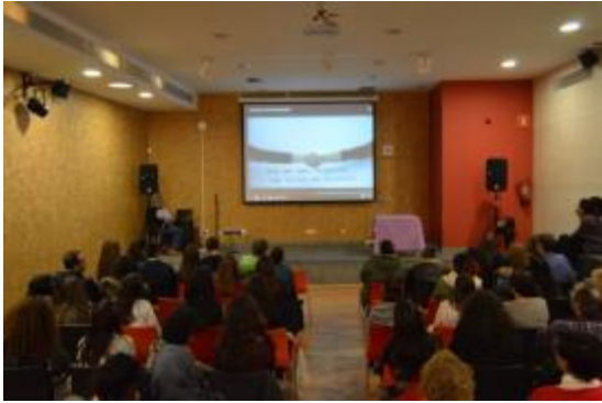
Visualització Campanyes Joves del projecte GEAR