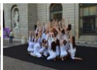
20/6/16 Dones de Blanc