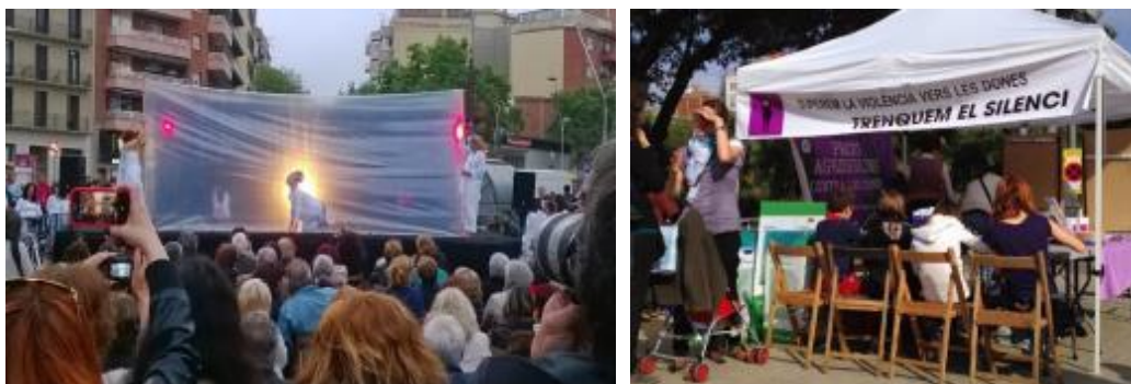
Imatges de l'actuació de Dones de Blanc i el taller infantil de xapes