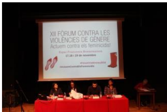
La documentació del femicidi a Catalunya i a l'estat Espanyol: un Observatori de la societat civil organitzada

Aquest Fòrum ha sigut una invitació per a implicar-se en l'eradicació de la violència masclista i dels femicidis. Des del teixit social i associatiu, i des de la societat en general, ens hi hem de posicionar, i denunciar aquestes discriminacions a les institucions, per fer sentir la nostra veu.