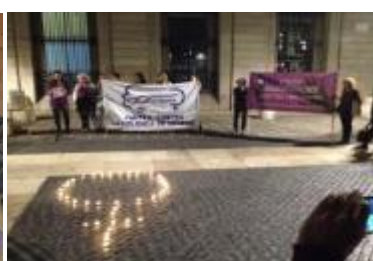
17/10/16 Associació de dones Ca l'Aurèlia