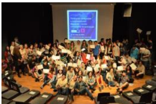
Cloenda del 2n seminari per al professorat i foto grupal de la Jornada