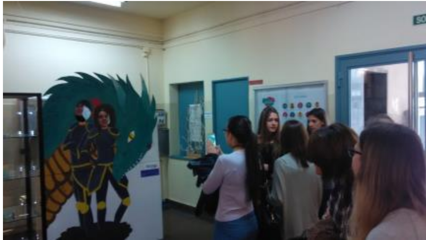
Fotocall dissenyat per l'alumnat del Institut Moisès Broggi durant la celebració de Santa Georgina 2016