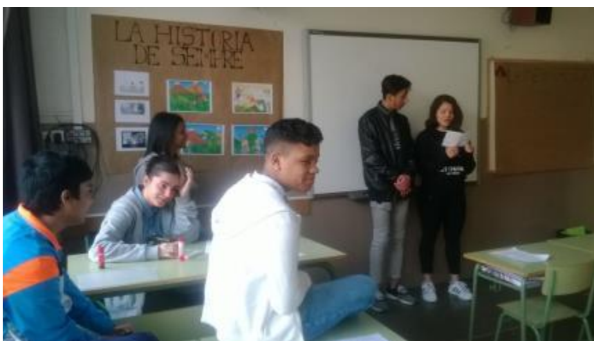
Activitat dinamitzada per l'alumnat del Milà i Fontanals durant la celebració de Sant Jordi Jordina, 2016

Finalment l'acte es va realitzar el 22 d'abril amb les bases del Concurs literari que implicaven la igualtat de gènere i amb diversos tallers per a l'alumnat, dos dels quals duts a terme per les i els adolescents del APS: una gimcana, un taller de còmic i de creació de punts de llibres amb perspectiva de gènere.