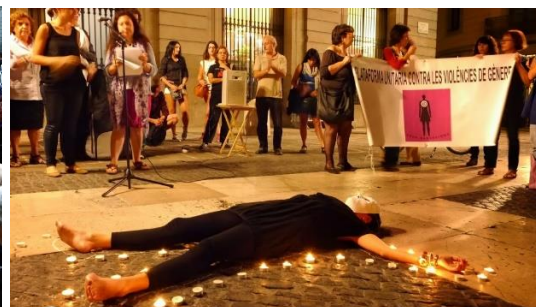
Concentració del 20 d'octubre