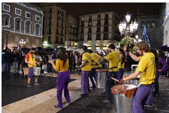
Batucada durant la concentració del 15 de desembre