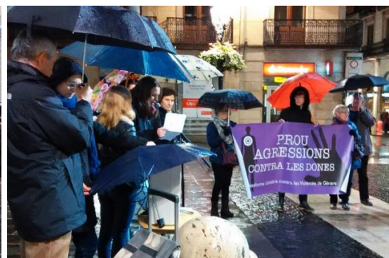
Nova pancarta estrenada durant 2014