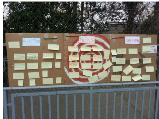
Acció duta a terme a l'Institut Joan Brossa