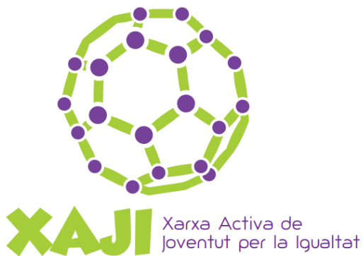
Logotip del projecte