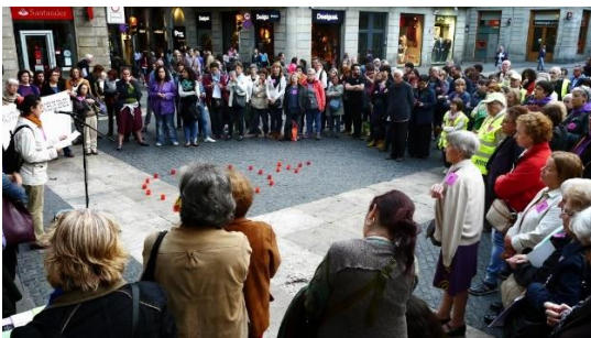
Concentració e 19 de maig