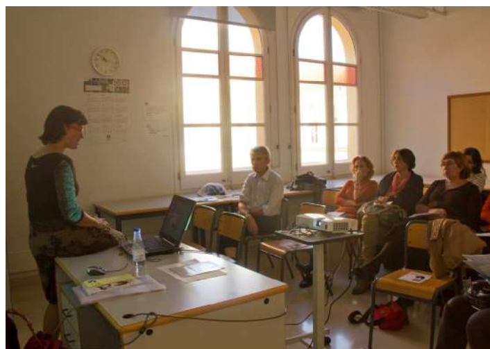
Taller dirigit a personal docent, el 16 de novembre al VIII Fòrum contra les violències de gènere

Aquests tres dies que va durar el Fòrum més de 1.800 persones, entre elles 550 adolescents, van reflexionar i participar en un total de 54 activitats, de temàtica molt diversa: identificació de la violència, defensa personal, violència sexual, tràfic de dones, construcció de noves masculinitats, com actuar quan es té coneixement de situacions de violència que estan succeint al voltant i un llarg etcètera.