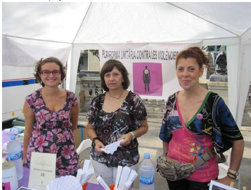
Voluntàries a la Mostra d'Entitats Catalanes, l'11 de setembre.

L'11 de setembre, vam estar a la Mostra d'Entitats Catalanes amb una paradeta de sensibilització ciutadana i de difusió dels projectes.