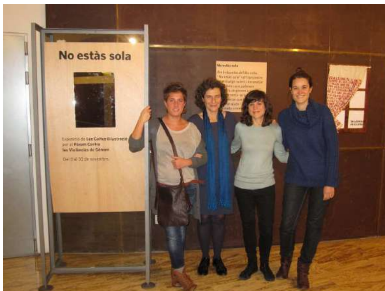
Inauguració de l'exposició No estàs sola , amb Les Golfes Il·lustració

Les Golfes Il·lustració, van preparar l' Exposició No estàs sola , visible a l'Espai Francesca Bonnemaison del 5 al 30 de novembre.