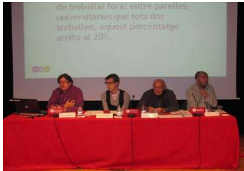
Taula rodona Canviem el patró de la masculinitat, elements per fer el canvi

Plataforma unitària contra les violències de gènere Rambla de Santa Mònica, 10 1ª planta 08002 Barcelona Telf. 627398316 prouviolencia@pangea.org - www.violenciadegenere.org NIF: G63627418 Número d'inscripció al Registre d'Associacions: 29709