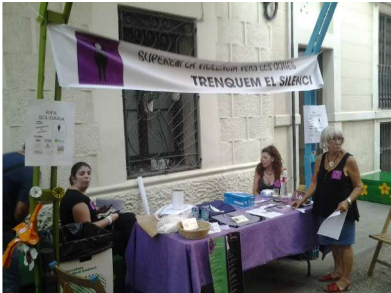
Paradeta informativa a la Rifa Solidària en benefici del projecte Trenquem el Silenci. 21 d'agost, festes de Gràcia Barcelona

Plataforma unitària contra les violències de gènere Rambla de Santa Mònica, 10 1ª planta 08002 Barcelona Telf. 627398316 prouviolencia@pangea.org - www.violenciadegenere.org NIF: G63627418 Número d'inscripció al Registre d'Associacions: 29709