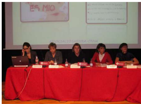
Taula rodona Cap a la conquesta del propi cos, sexe i dona avui

La violència sexual moltes vegades és legitimada i es culpabilitza a la víctima. Les dones interioritzem moltes pors al respecte i els drets sobre el nostre propi cos són contínuament vulnerats. Hi ha violència quan una dona és forçada a mantenir relacions sexuals, també hi ha violència quan una dona no pot decidir quedar-se embarassada; seguir endavant amb el seu embaràs o interrompre'l.