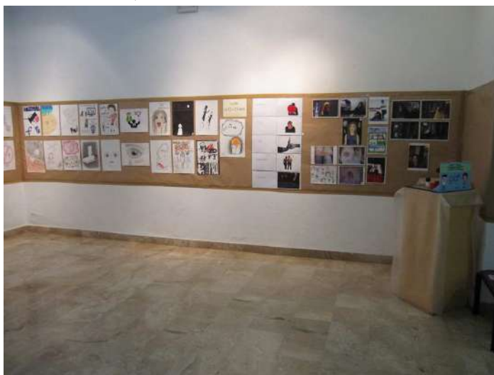
Exposició de les obres del Concurs per l'eradicació de la violència masclista

Un any més, el Concurs per l'eradicació de la violència masclista , va estar un èxit de participació amb més de 330 obres presentades, majoritàriament de centres educatius d'arreu de Catalunya, fet que confirma la implicació de la comunitat educativa en la prevenció de la violència masclista. Les obres presentades a concurs, van romandre exposades a la seu de la Plataforma, Rambla Santa Mònica, 10 del 5 al 30 de novembre.