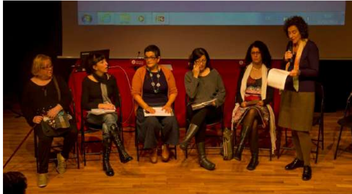
Presentació de les xarxes participants, 15 de novembre

Davant de qualsevol situació de violència masclista ens hem de posicionar, no existeix la neutralitat. Es tracta d'un problema de salut pública , que afecta a dones molt diverses en edat, cultura, nacionalitat, etc. i que moltes d'elles la pateixen en silenci. Al llarg de la història ha estat una forma de control de la llibertat femenina.