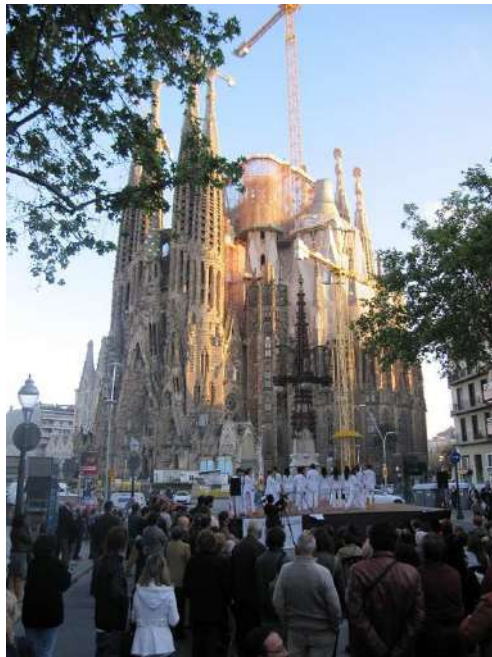
Actuació de Dones de Blanc a la Festa Major de Sagrada Família, 1 de maig de 2012

Plataforma unitària contra les violències de gènere Rambla de Santa Mònica, 10 1ª planta 08002 Barcelona Telf. 627398316 prouviolencia@pangea.org - www.violenciadegenere.org NIF: G63627418 Número d'inscripció al Registre d'Associacions: 29709