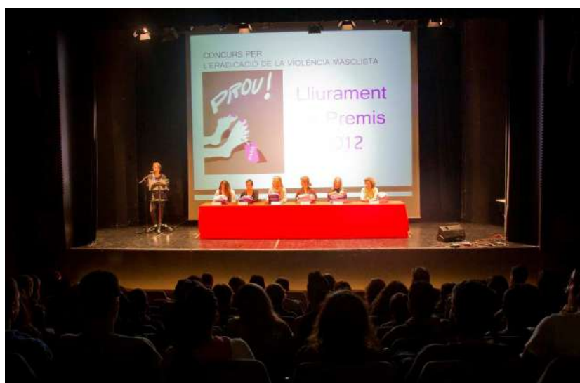
Lliurament de premis del Concurs per l'eradicació de la violència masclista

Plataforma unitària contra les violències de gènere Rambla de Santa Mònica, 10 1ª planta 08002 Barcelona Telf. 627398316 prouviolencia@pangea.org - www.violenciadegenere.org NIF: G63627418 Número d'inscripció al Registre d'Associacions: 29709