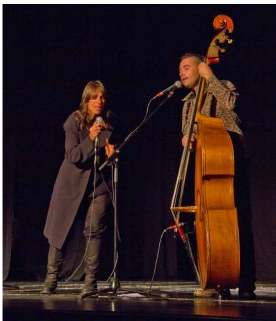
Actuació Lidia Pujol a la Cloenda, 17 de novembre

Per finalitzar el Fòrum, va tenir lloc la cerimònia de cloenda, en la que van participar les actrius Vicky Peña i Carme Sansa, la cantant Lidia Pujol, i les Dones de Blanc, que van retre homenatge a les dones assassinades durant 2012, a causa de la violència masclista.