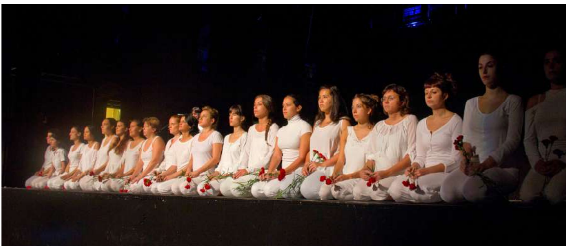
Homenatge a les dones assassinades, Dones de blanc a la Cloenda, 17 de novembre

Plataforma unitària contra les violències de gènere Rambla de Santa Mònica, 10 1ª planta 08002 Barcelona Telf. 627398316 prouviolencia@pangea.org - www.violenciadegenere.org NIF: G63627418 Número d'inscripció al Registre d'Associacions: 29709