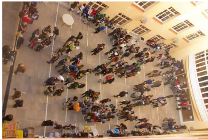
Preparatius dels tallers dirigits a joves, 16 de novembre

Enguany fa 10 anys de la constitució de la Plataforma Unitària contra les Violències de Gènere. Deu anys de treball compartit en els quals s'han anat sumant esforços d'associacions d'arreu amb finalitats diferents però amb un objectiu comú: dir NO a la violència masclista i posar punt i final a aquesta xacra social. El Fòrum, en la seva vuitena edició, s'ha constituït com un espai de trobada, d'intercanvi, formació i establiment de noves fites a assolir.