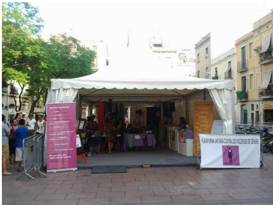
Presència a l'Espai Solidari de l'Ajuntament de Barcelona a les Festes de Gràcia. 20 d'agost

El 20 d'agost, taller infantil de xapes a l'Espai Solidari de l'Ajuntament de Barcelona a les festes de Gràcia. Paradata informativa i taller infantil de xapes.