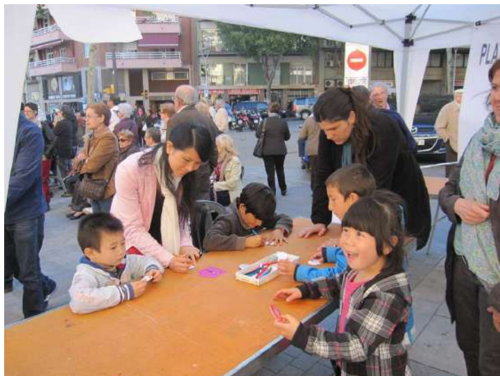
Taller infantil de xapes a la Festa Major de Sagrada Família, 1 de maig de 2012

L' 1 de maig, en el marc de la Festa Major del barri de la Sagrada Família de Barcelona, vam fer diverses activitats al carrer. Parada informativa i de sensibilització, taller infantil de xapes, obra de teatre participatiu a càrrec d'Averlasailas i homenatge a les dones assassinades a càrrec de Dones de Blanc.