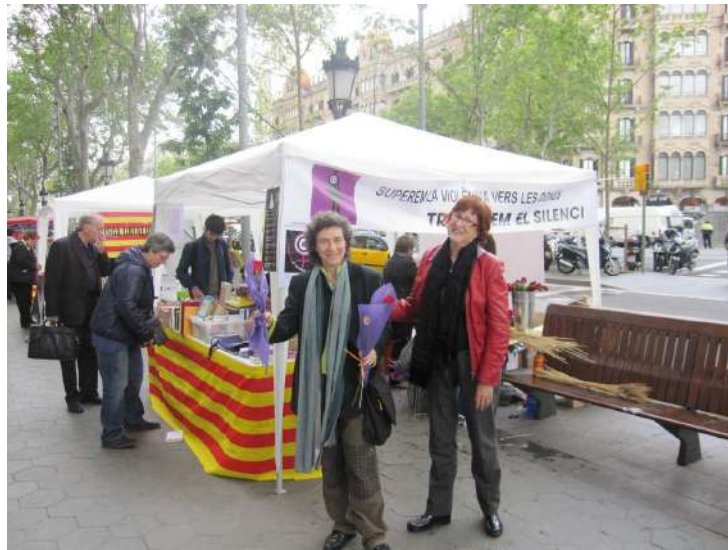
Paradeta solidària sensibilització, 23 d'abril

Plataforma unitària contra les violències de gènere Rambla de Santa Mònica, 10 1ª planta 08002 Barcelona Telf. 627398316 prouviolencia@pangea.org - www.violenciadegenere.org NIF: G63627418 Número d'inscripció al Registre d'Associacions: 29709